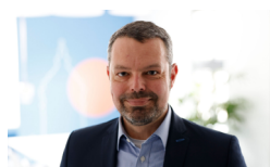
Arnd Suck Rhein-Neckar-Odenwald